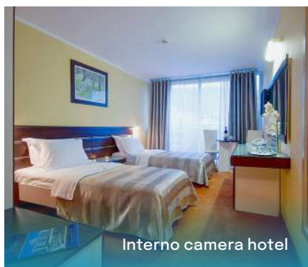
Interno camera hotel